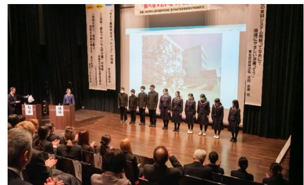
▲「北の杜学」の各チームでの取り組みを報告する青森市立北中学校の11人