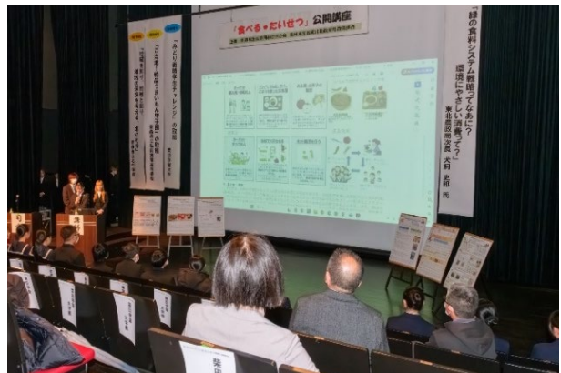
▲6グループの取り組みを報告する柴田学園大学の17人の学生